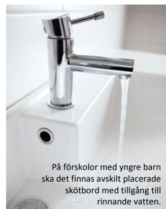
På förskolor med yngre barn ska det finnas avskilt placerade skötbord med tillgång till rinnande vatten.

Avfall bör förvaras i ett ventilerat, separat utrymme alternativt i ett kylt soprum för att undvika att verksamheten eller boende i närheten störs av dåligt lukt från exempelvis matavfall och använda blöjor. Utrymmet bör placeras på minst åtta meters avstånd från friskluftsintag, bostadsfönster, balkonger och uteplatser. Avfallet från verksamheten bör inte blandas med avfallet från eventuella övriga hyresgäster. I de fall miljöförvaltningens råd inte går att genomföra kan det bli aktuellt med tätare hämtningsintervall för avfallet, speciellt sommartid. Enkel källsortering kan med fördel göras som en del i den pedagogiska verksamheten.