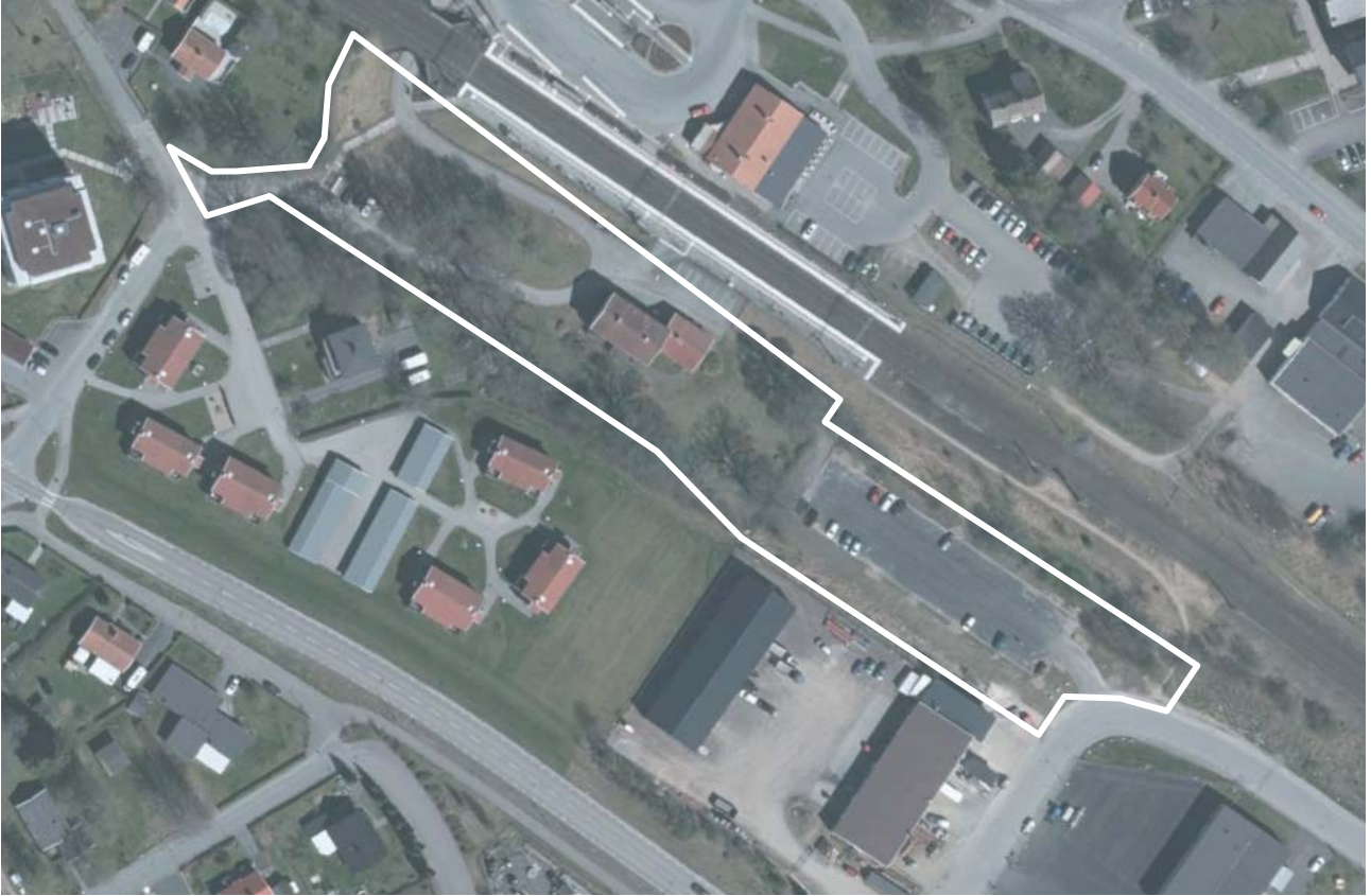
Ny föreslagen avgränsning, ortofo