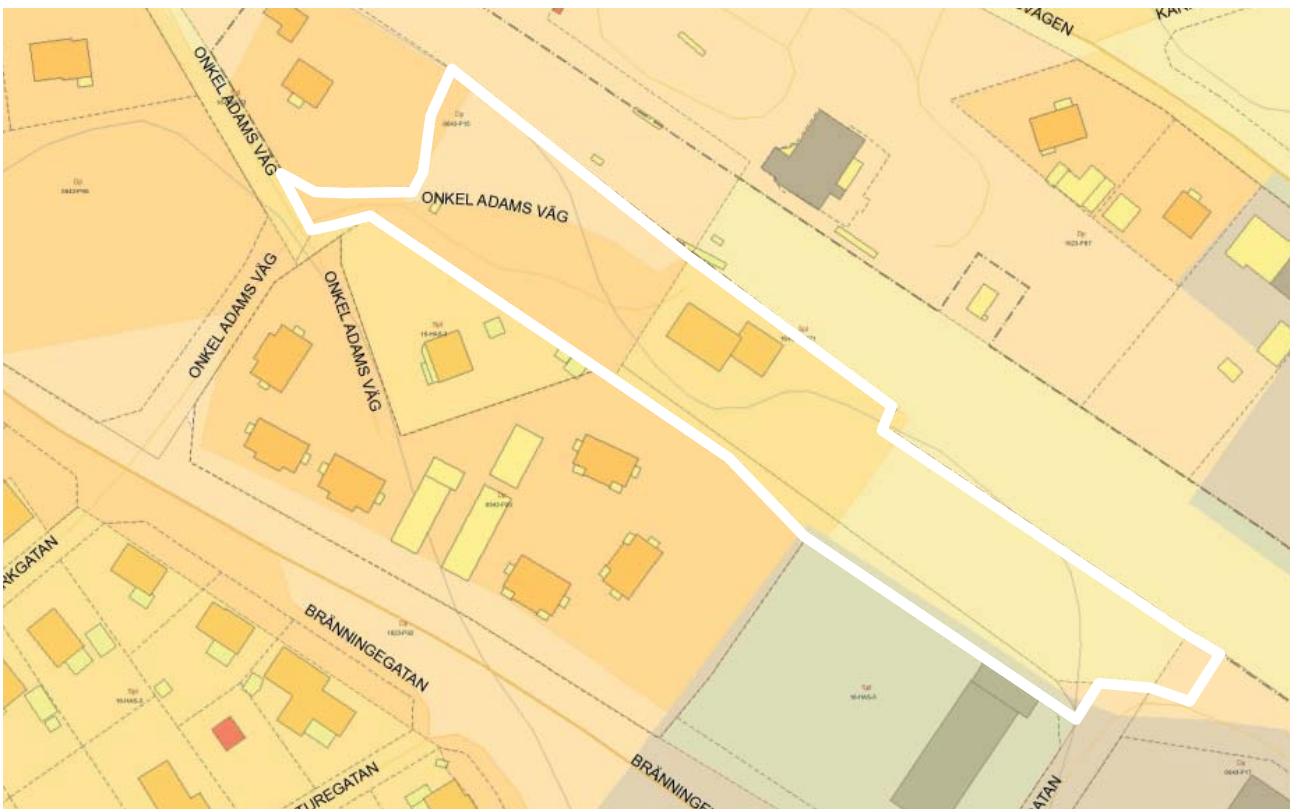
Ny föreslagen avgränsning, gällande detaljplaner